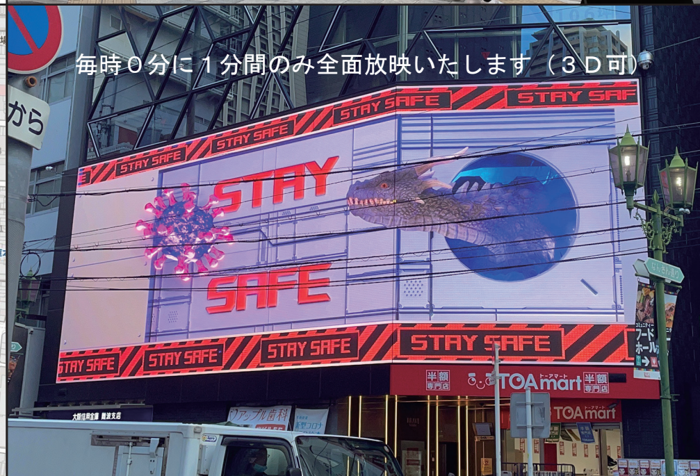
毎時0分に1分間のみ全面放映いたします (3D可)