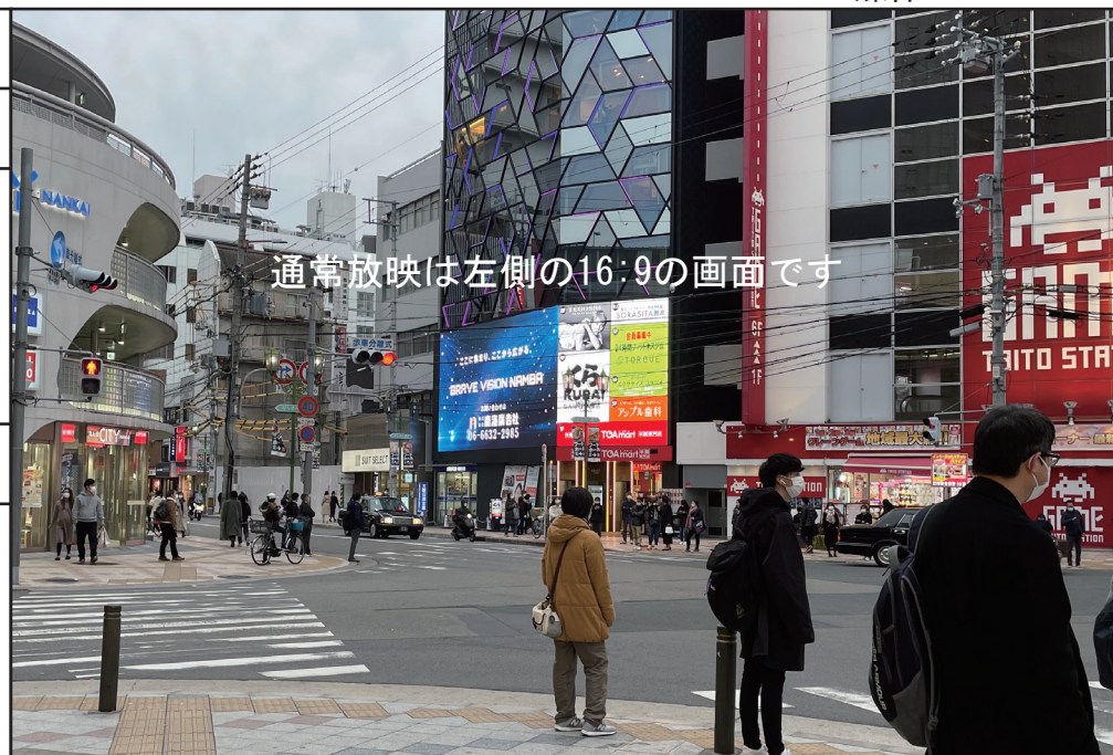
通常放映は左側の16:9の画面です